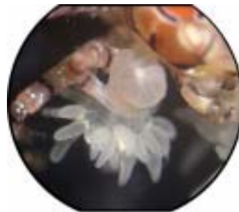
写真1 はさみにはさまれたイソギンチャク

ところで、なぜこのキンチャクガニを探していたかということ、このキンチャクガニとその2本のはさみにつけているイソギンチャクとの関係に興味があったからです。2mmくらいの小さく白いイソギンチャクで、その名もカニハサミイソギンチャクといいます。キンチャクガニは、