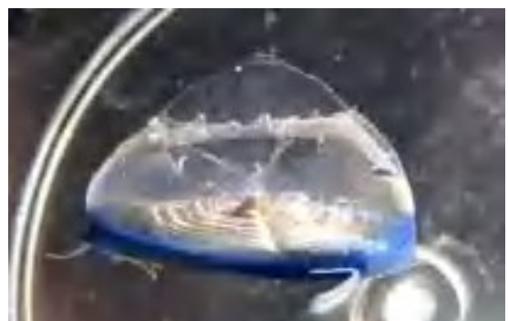
カツオノカンムリ

よく港の中の片すみにゴミが吹きよせられますが、ここにも生き物がいます。先月、水面に浮いているゴミをすくってみると、だ円形の薄い板の上に透明な三角形の‘帆’ ほ をもつ不思議な形の生き物