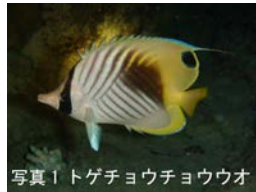
写真1 トゲチョウチョウウオ

でもあります。ですから、そこを攻撃されないようにどこに目があるのかわからないようにしていると考えられています。そして、トゲチョウチョウウオなど（写真1）では、さらに背びれなどに黒点の模様をいれて、‘こっちが目だ’とだまそうとしていると言われています。チョウチョウウオの模様は、ただきれいなだけではないのです。