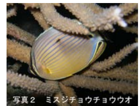
写真2 ミスジチョウチョウウオ

（写真2）、ヤリカタギはテーブル状ミドリイシの下で寝ているのを良く見かけるのです。けれど、違う言い方をすれば、それだけサンゴと密接にかかわって暮らしているということでしょう。